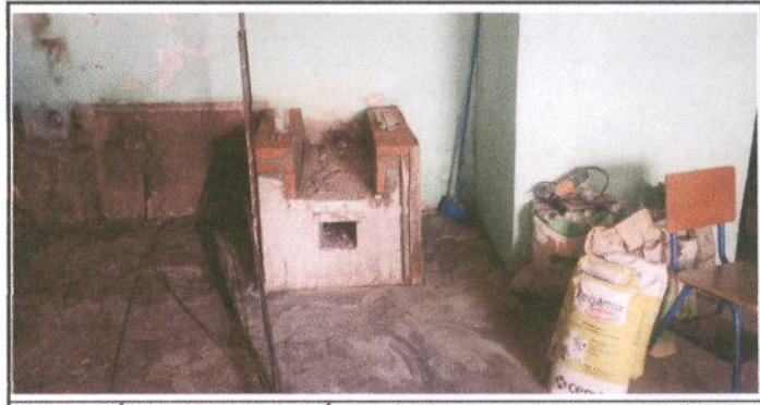
Foto 6: MÓDULO 3 REPARACIÓN DE COCINA: Sustitución de estufa rural (completa) incluye chimenea y plancha de metal.

Observación: Si es necesario se pueden agregar hojas adicionales y actualizar el número de hojas.