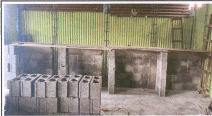
Foto : MÓDULO 2 AULAS MUROS: Reparación de muro perimetral de block