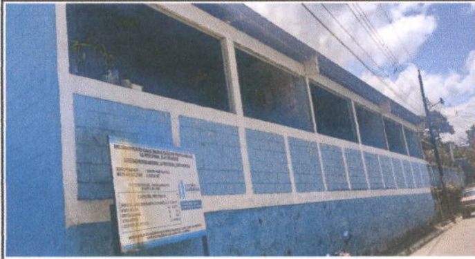
Foto1: MÓDULO 1 AULAS VENTANAS: Sustitución de estructura de metal de ventana, Mantenimiento a balcones de metal