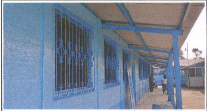
Foto 2: MÓDULO 2 AULAS VENTANAS: Sustitución de estructura de metal de ventana, Sustitución de balcones de metal