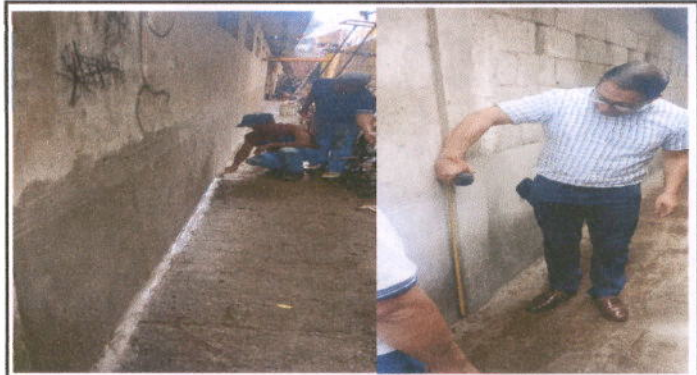
Foto 4: MÓDULO 2 REPARACION DE REPELLO Y CERNIDO DE PAREDES: Repello en muro